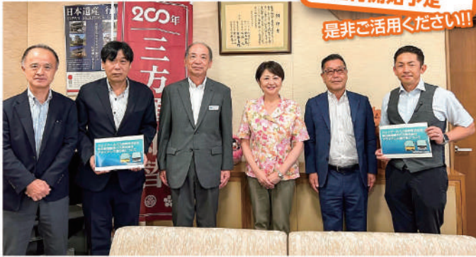
行田市長に事業の説明と広報についてお願いしました。