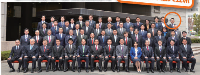
埼玉県庁前にて集合写真